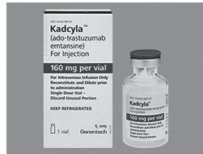
(Kadcyla Inj 160mg)