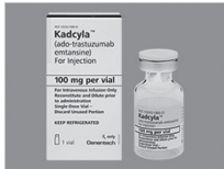
(Kadcyla Inj 100mg)