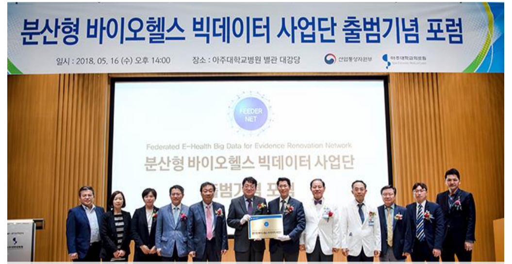
분산형 바이오헬스 빅데이터 사업단 출범식 개최 (5/16)