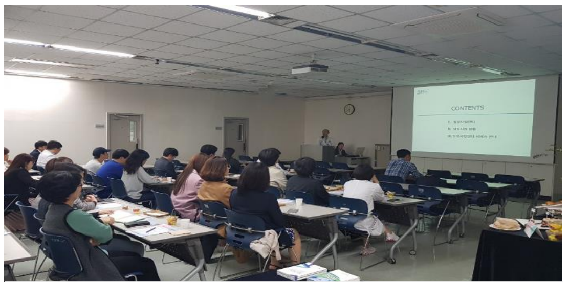
임상의과학자 연구역량강화사업 세부과제 중간보고 워크숍 개최 (4/23)