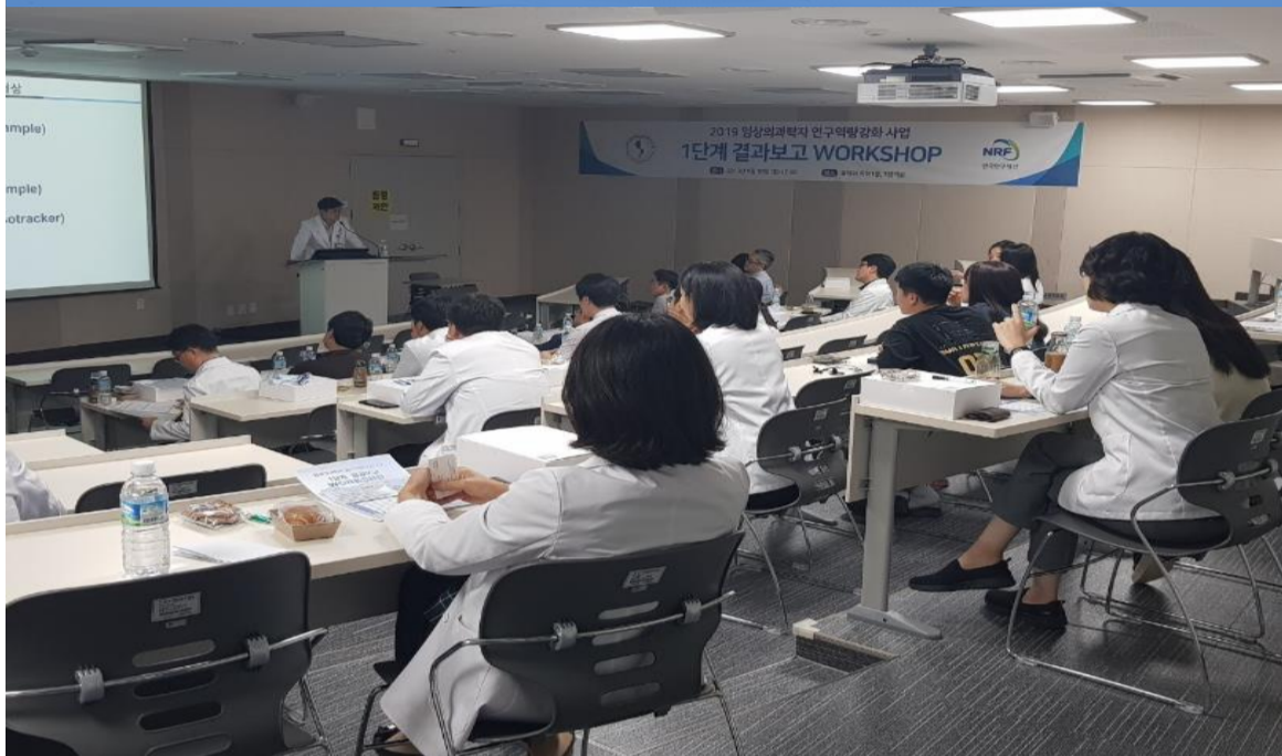
「임상의과학자연구역량강화사업」 1단계 결과보고 워크숍 (9/30)