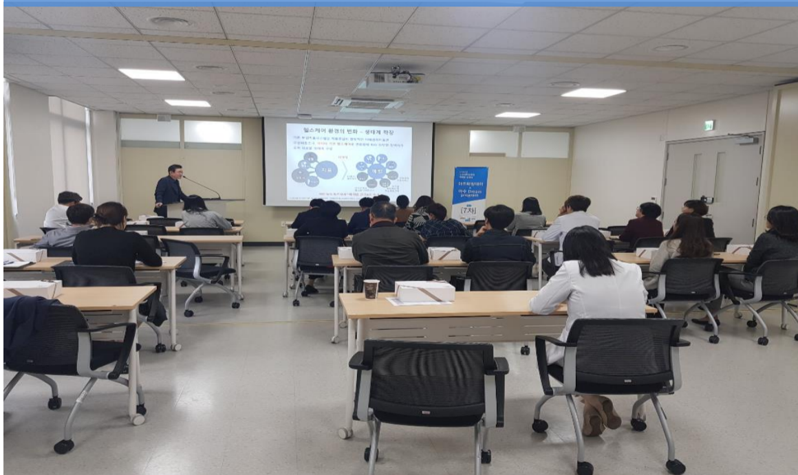
「개방형실험실 구축사업」 아주매칭데이 & 아주드림프로그램 (10/23)