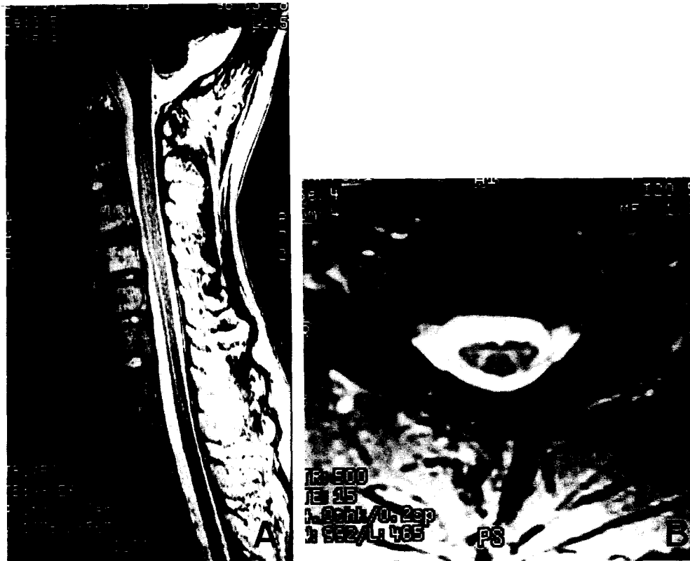
Fig. 2. Mid- to lower cervical cord atrophy on T2-weighted sagittal spine MRI(A) and prominent cord atrophy at C 6 level on T2-weighted axial image(B).