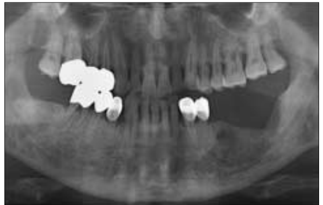
Fig. 2. Osteolytic lesion on the left mandibular posterior area(Panoramic view).