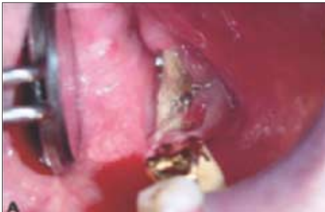
Fig. 1. Purulent inflammation and necrotic bone.

이환범위가 좁고 증상이 심하지 않은 경우는 보존적인 치료(항생제 복용과 수개월간의 클로르헥시딘 가글 처방)